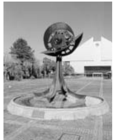
キュパティ-ノ市の シンボルタワー-が立 つ総合体育館前広場

市では、総合体育館前のエリアを「キュパティーノ広場」と命名し、使節団来豊時に合わせ、11月15日(土)午後、セレモニーを予定しています。同時にキュパティーノ市から贈られる新しいモニュメントの除幕式も行います。終了後、会費制によるレセプションが計画されています。参加者は広く一般から募集する予定です。協会からも、多数の会員が積極的に参加し、交流を深めましょう。