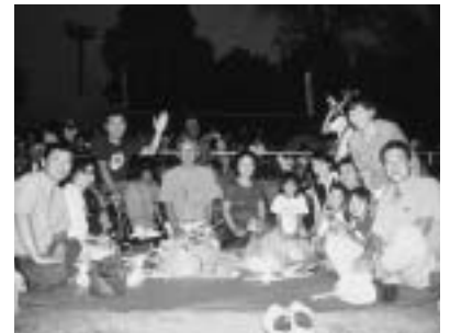
ニイハオサークルの手筒まつり交流会

ニイハオサークルは、毎年、市内の企業に短期研修で訪れる中国人との交流を実施していますが、今年は10月11日(土)コニカミノルタ(株)の研修生8人を交えて、昼食会を行いました。一行は、広東省、江西省など中国南部から来豊し、8月19日(火)から11月8日(土)まで技術研修を受けています。ニイハオサークルでは、日本語をはじめ日本での生活上の相談などについて助言しながら、中国の最近の生活の様子を教えてもらっています。