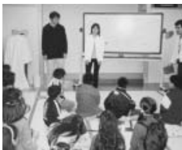
ペルーの子どもを対象にした学習支援活動の様子

その他、清掃活動、スポーツ交流などを通じ、お互いの国の文化や習慣を理解し、地域の人々との交流と共生を願って、多彩なボランティア活動を実施しています。