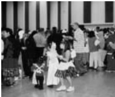
盛り上がったフェスティバル

フェスティバルはとてもすばらしく、よく計画がなされ、魅力がいっぱいで、たくさんものを見ることができました。みなさんに言いたいことがあります。まず最初に私を招待してくれた友だちに感謝します。次に企画を担当して下さったみなさんにも感謝します。そしてこのすてきなフェスティバルに集まったすべてのみなさんにも感謝します。みなさんと友好を図り、協力しあい、