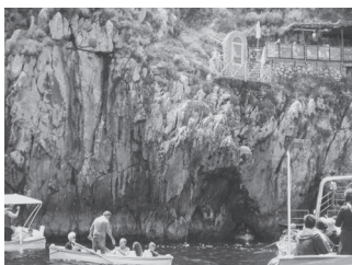
青の洞窟の狭い入り口

3日目、カリブ島へよほど運がよくないと入れない青の洞窟へ。何と、どこも待たずにスムーズに！こんなことって滅多にないとのこと。カリブ島での昼食中、男性の方が気分が悪くなり、B子さんが医者だと名乗り出て、救急車を呼ぶことに。車