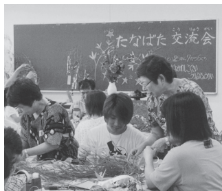
七夕飾りに挑戦中