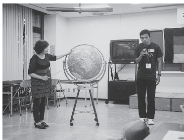
大地球儀でお国紹介