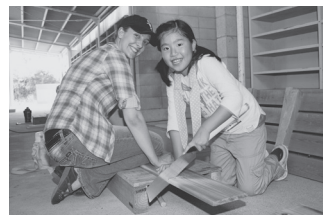
うまく切れるかな