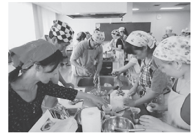
皆さん、手際いいです

タイ料理というと、かなり辛めのグリーンカレーが有名ですが、今回のえびカレーは辛くなく、マイルドなカレーでした。参加した皆さんもタイ料理が好きな方ばかりで、独特の香りや辛みにも「おいしい!!本格的!!」の声をたくさん聞きました。