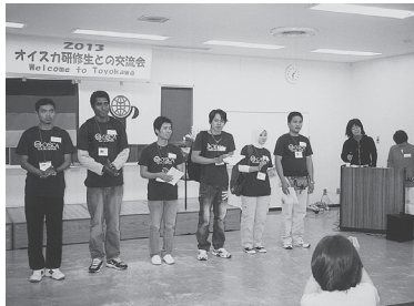
自己紹介する研修生

農業施設を見学し、午後6時から勤労福祉会館視聴覚室で、フレンドシップ部会の企画による茶話会形式の交流会を開催しました。