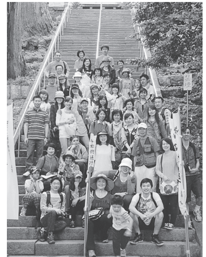
東照宮前の石段で集合写真

午後は、新城市長篠城址史跡保存館に寄り、その後買い物をして、全員笑顔で予定どおり午後4時に到着しました。日本語教室は、毎週土曜日の夜、勤労福祉会館で開講している通常の教室に加え、新たに毎週月曜日から木曜日までの午前中、諏訪のプリオで「ひるまクラス」を開講し、規模が大きくなりました。今後の運営を考えると、有意義な「春のバス遠足」だったと思います。