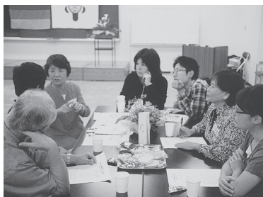
グループに分かれ交流