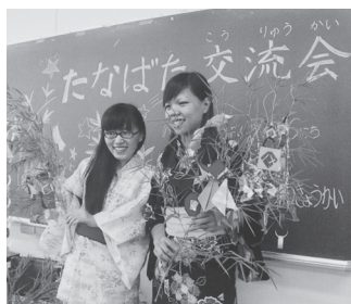
浴衣姿で記念撮影