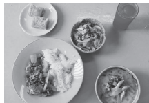
ボリュームたっぷり

メニューは、ヤムウンセン(春雨サラダ)、トムヤムガイ(トムヤムクワの鶏肉バージョン)、グンパッポンカレー(えびカレー)、カーノンクルワイ(バナナようかん)、ナンプルマイパン(フルーツジュース、今回はスイカジュース)でした。