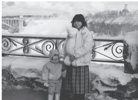
目にするものの少ない、厳寒期の ナイアガラの滝にて。奥さんと娘さん

カナダ滞在中も車でどこでも行きました。夏休みはモ ントリオールからフランス語圏であるケベック州の観光 地巡りをしました。その年の10月29日に2番目の娘を授 かり、家族は4名になりました。その後、カナダで2度目